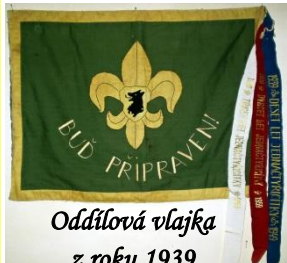
Oddílová vlajka z roku 1939