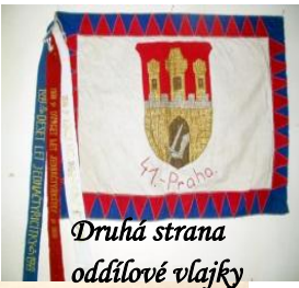
Druhá strana oddílové vlajky